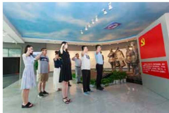
全体党员参观新四军纪念馆

校友会办公室追寻了校友的青春印迹和多年来默默奉献的人生轨迹。寻访中，校友毕业后进入职场的真实现状以及他们立足岗位成长、成才的典型事例，对于学校培养优秀校友、建设良好校风具有宝贵的借鉴价值。“树榜样、立标杆——聚焦立德树人”，校友们在校时勤奋刻苦、好学求知的精神能鼓舞在校大学生好好学习、天天向上；他们面对困难时吃苦耐劳、坚韧不拔的品格也能感染学生不畏艰难、奋勇前行；校友们在各自工作岗位上做出的优异贡献更能激励晓庄学子孜孜不倦、勤勉争先。