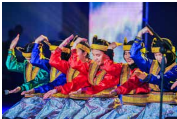
萨满舞精彩表演掠影