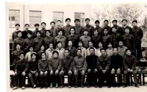
图2为77届师专班毕业照