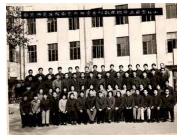
图3为78届师专班毕业照