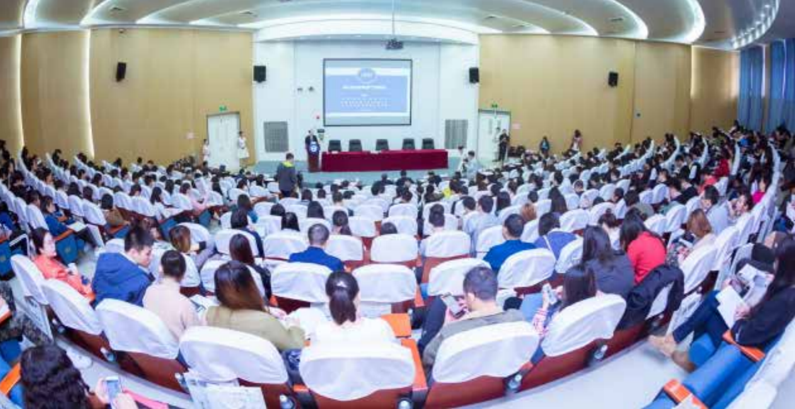
生活教育百年学术论坛在我校举办