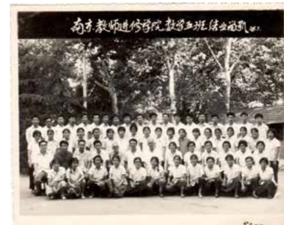
图1为77届脱产教师进修班结业照

从上世纪80年代起，数学系几乎每年招一到两个脱产进修班，学制两年，考试合格，发专科文凭。对在农村插队七八年，失去了上大学机会的知青教师，有两年脱产学习来填补知识的空