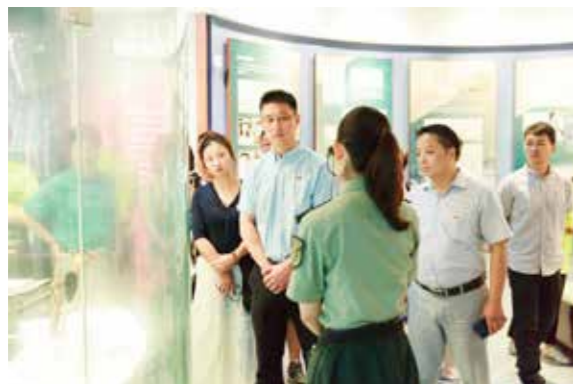
全体党员参观新四军纪念馆

寻访中每一位校友都分享了他们难忘的晓庄岁月，回顾了他们辛苦的职业生涯，展望了他们的未来蓝图。他们的故事于南京晓庄学院是弥足珍贵的宝藏，值得我们去了解、去研究、去弘扬。