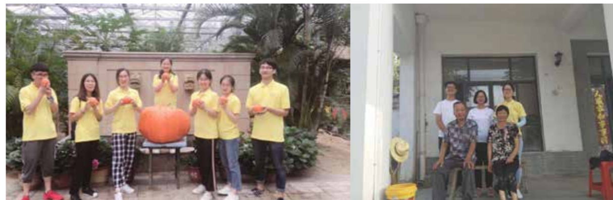
调研队员与华西村种植园内太空育种技术的大南瓜

2018 年 8 月 2 日—6 日，晓庄学院商学院的同学们先后走进江苏华西村和安徽小岗村，开展了为期 4 天的两地改革开放 40 周年居民生活变迁调研活动。