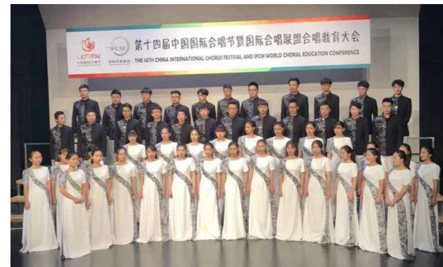
行知合唱团参加中国国际合唱节

第十四届中国国际合唱节日前在北京举行，我校行知合唱团表现突出，荣获成人混声组A级合唱团金奖。本届合唱节的主题是“在北京听世界的歌声”，共有59个国家的308支合唱团、21名国际评委和15000名歌手参加。