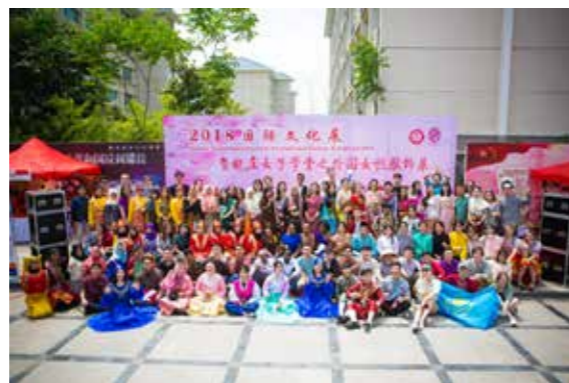
11 个国家 150 名留学生参加了活动

为了办好此次活动，海外教育学院精心策划，以国别为单位进行布展。为使活动更加丰富有趣，现场还设置了互动环节，参加人员可领取活动专用护照至各国展台盖章，集齐所有印章即可兑换印制有各国女性服饰的精美礼品。