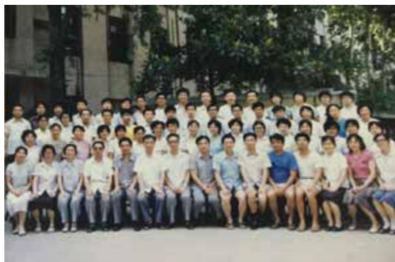
图5为84级脱产教师进修班毕业照