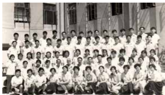
图4为80级脱产教师进修班毕业照

从学员管理来说，每一个脱产进修班里都配备了兼职班主任，每班设班委会、团支部，负责组织班级活动和共青团活动，并组织参加一年一度全校的文艺演出和运动会，以增强学员体质，活跃学员紧张的学习生活。