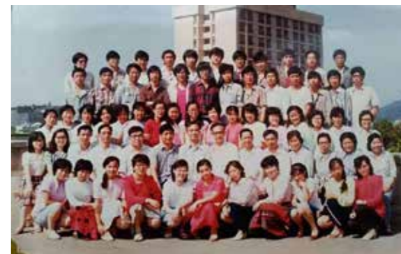
图7为84级新疆班毕业照