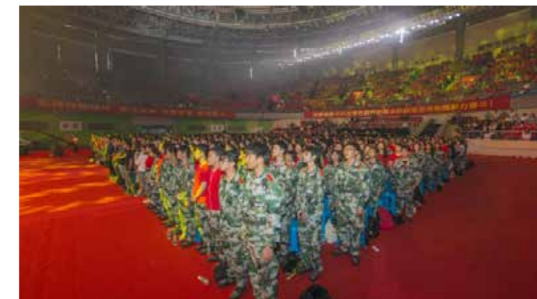
4000 多名 2018 级新生参加了开学典礼

迎新文艺演出随着歌舞《梦想开始的地方》拉开序幕，师生倾情打造的一个个节目精彩纷呈，为甫入晓庄的 2018 级新生带来了一场视听盛宴。