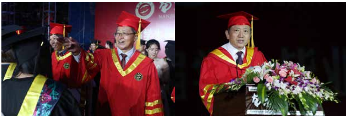
全体校领导和主礼教授为毕业生拨正流苏