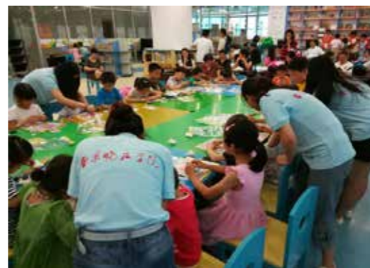
“小先生阅读推广志愿服务团”开展手工活动

学校日前收到一封来自金陵图书馆的感谢信，信中感谢我校“小先生阅读推广志愿服务团”在该馆第四届“七彩夏日”少儿暑期夏令营活动中所付出的努力，感谢志愿者们为开展全市全民阅读，尤其是青少年阅读推广注入了新的能量。